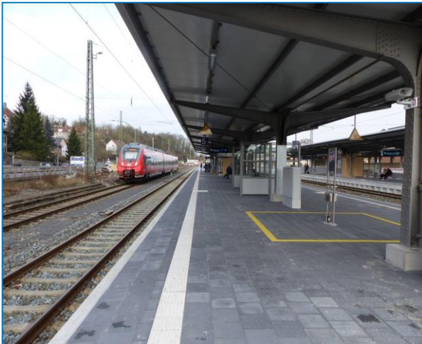
Coburg Bf – Blick in Richtung Gleis 6