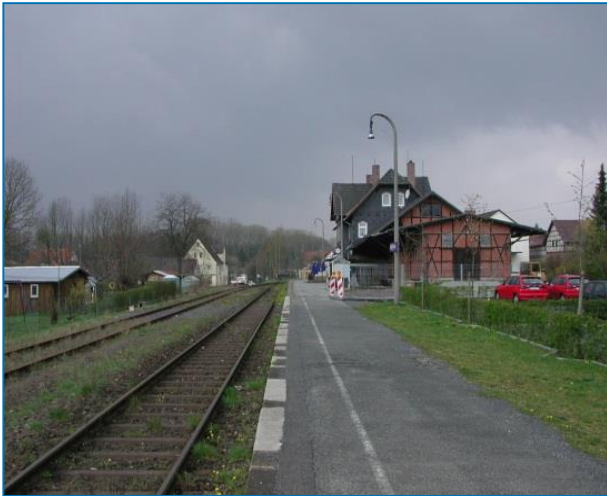
Bahnhof Bad Rodach