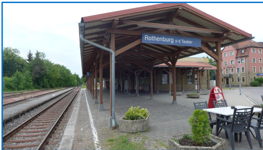
Rothenburg ob der Tauber