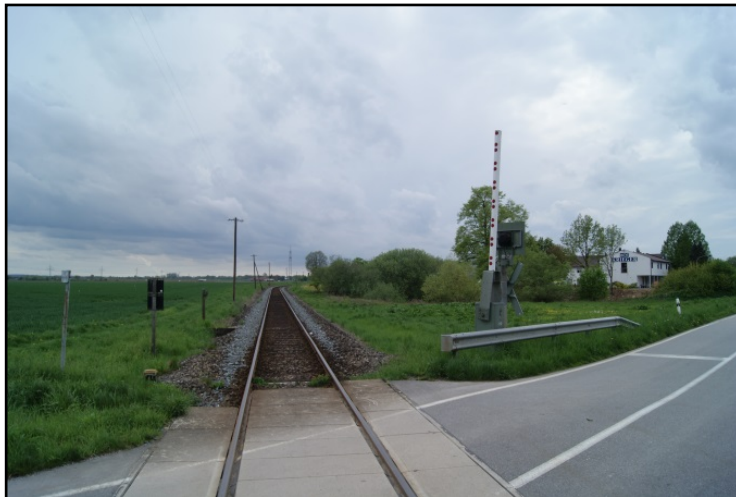
Standort geplanter Halt Straubing-Hafen

Strecke: Neufahrn – Straubing - Bogen (5812)