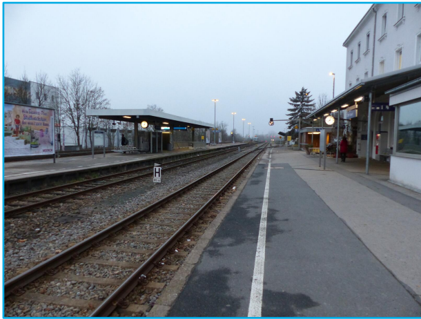
Bahnhof Cham (Oberpfalz)

Strecke: Schwandorf – Furth im Wald (5800)