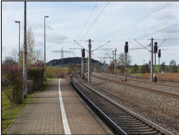
Bahnhof Gessertshausen Gleis 1 Bereich Abzweig Südliche Staudenbahn