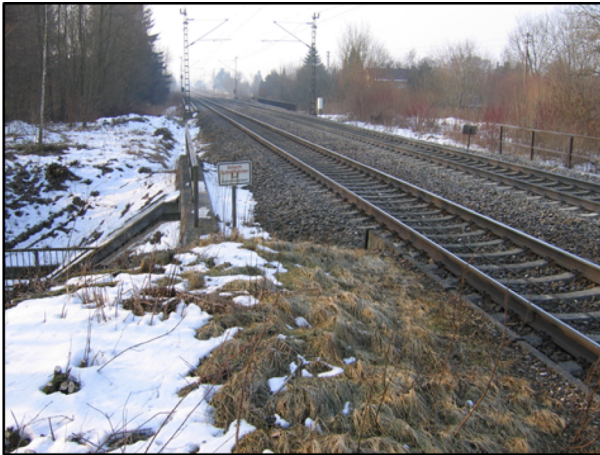
Bereich Bahn-km 10,5 Richtung Ulm