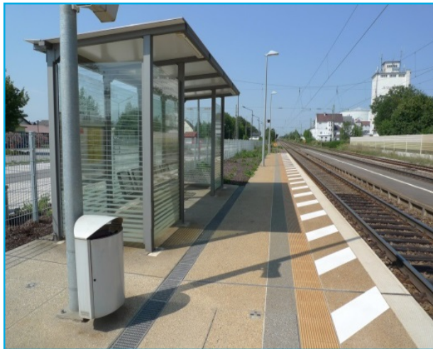
Bahnhof Sünching Blick von Gleis 1 auf den Zwischenbahnsteig