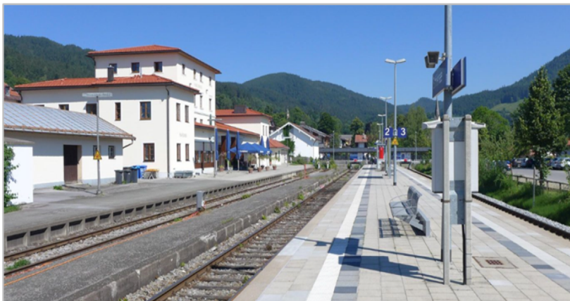
Bf Schliersee (vor Elektrifizierung), Quelle: BEG