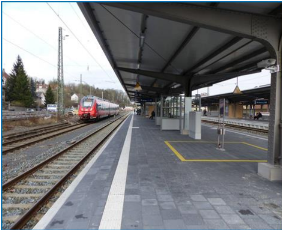
Coburg Bf – Blick in Richtung Gleis 6

Strecken: Lichtenfels – Coburg – Sonneberg (5121, 6311), Coburg – Bad Rodach (5122)