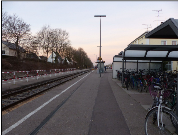
Bahnhof Friedberg (b. Augsburg)